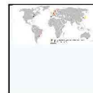
Information Technology Enterprise Resource Plan